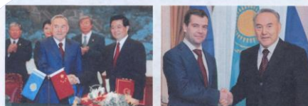
Н.Ә. Назарбаевтың КХР җаралығы Ху Цзиньтаомен кездесуі, 2006 жыл, 19 желтоқсан

Қытай Халық Республикасымен ЫНТЫМАҚТАСТЫҚ