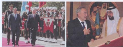
Н.Ә. Назарбаев пен Түркия Президенті Абдалла Гүл