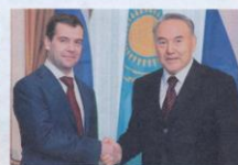
Н.Ә. Назарбаев пен Ресей Федерациясы Президенті Д.А. Медведев, 2008 жыл, 23 тамыр