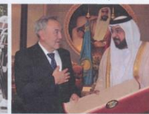
Н.Ә. Назарбаев пен БАӘ Президенті шейх Халифа бин Зайид әл-Нахайян, 2009 жыл, 17 наурыз